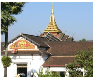
พระราชวังหลวงพระบาง/ลาว