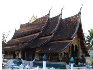
วัดเชียงทอง ศิลปะล้านช้างที่งดงาม